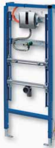
Suhomontažni element za pisoar (Halite)