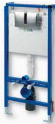
Suhomontažni element z WC splakovalnikom (Aplite Senso in Celestine)